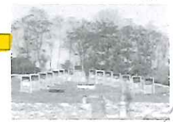
CHEM. D. CROIX DU XVIII e S.